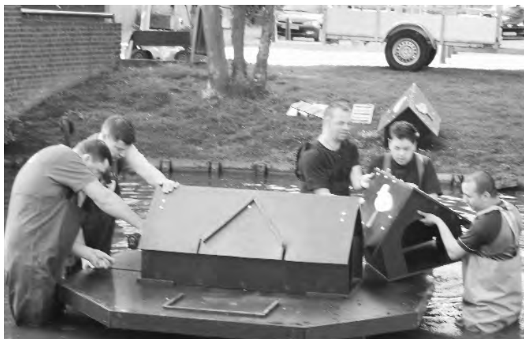
20 mei was het dan zover; de eendenkooi was klaar en werd door aannemingsbedrijf De Combi, geholpen door cliënten van Huize Thomas, te water gelaten in de Hoekersingel.

Ja, ze waren zeer tevreden. Ondanks dat ze begrip hebben voor het feit dat in de winter de kooi weg moet omdat hij anders vernield zal worden, is het voor hen iedere keer weer een feest als de kooi terug komt. Ze zijn dan wel gewend om buiten te leven, maar een kooi brengt allerlei voordelen met zich mee. Ze kunnen zich eens afzonderen en omdat hij zo groot is, kan men er ook vergaderen en zo. Hij is herkenbaar vanuit de lucht en dus een baken voor de trekkende familieleden die op bezoek komen. Zeker nu er ook nog afbeeldingen van henzelf op aangebracht zijn valt hij heel erg op. De opperwoerd van de singel houdt altijd alles bij en was dan ook de eerste die in de gaten had dat er in De Buut gewerkt werd aan hun onderkomen.