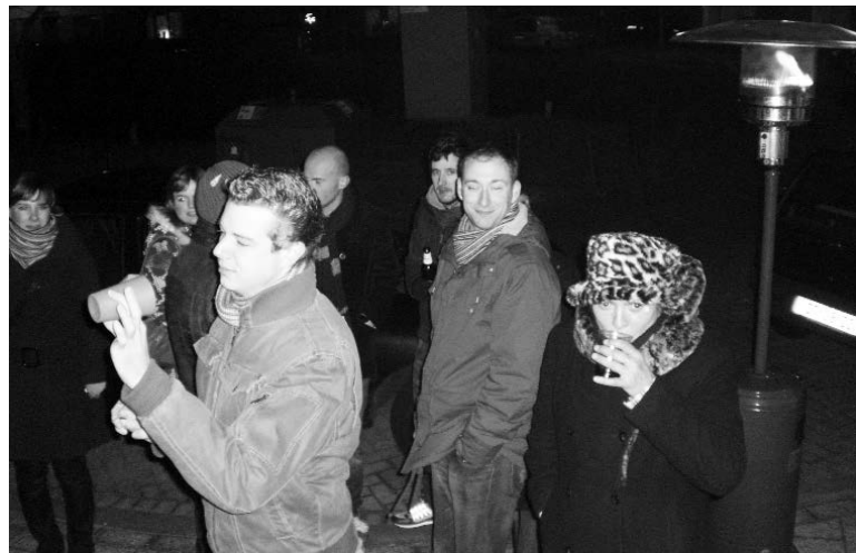
Even bijkomen bij de gasparapluie

De derde en laatste avond was het grote feest. Iedereen had wat eten