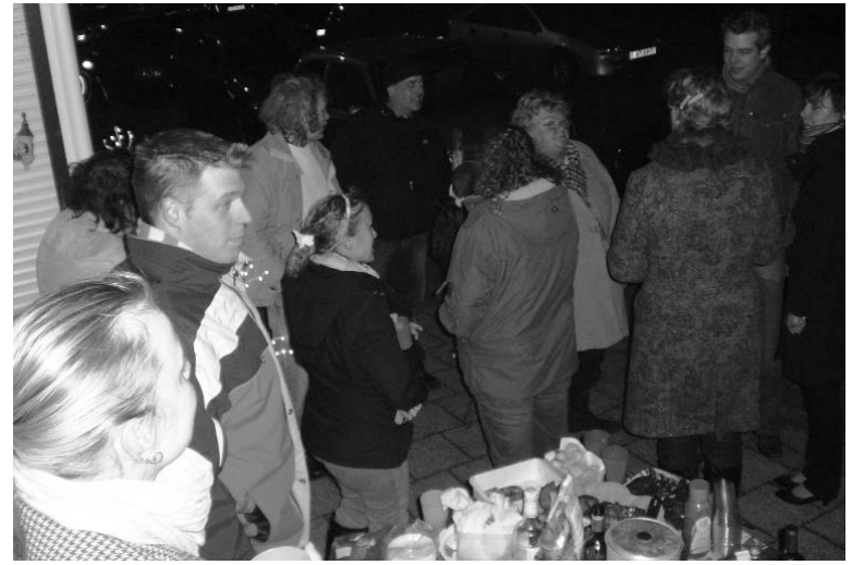
Hapjes en drankjes

Mee). Het was dit jaar weer erg koud, hierdoor was het vorig jaar jammer genoeg snel afgelopen. Dit jaar hadden we een gas-parapluie, welke een aangename verwarming gaf. Of waren het toch de Gluhwein en de warme chocolade melk (met rum) die ons warm hebben gehouden deze avond? Ik denk