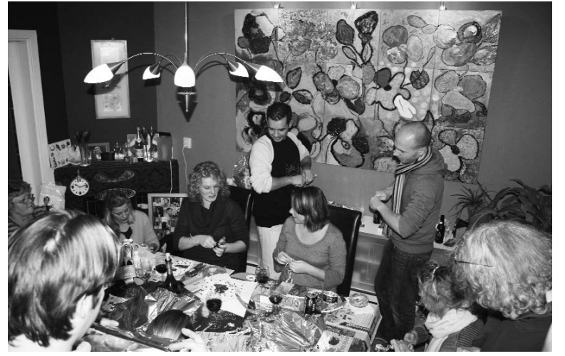
Met z'n allen de versieringen maken

klaar gemaakt en voor de drank werd gezorgd (dit door de waardebon van Opzoomer